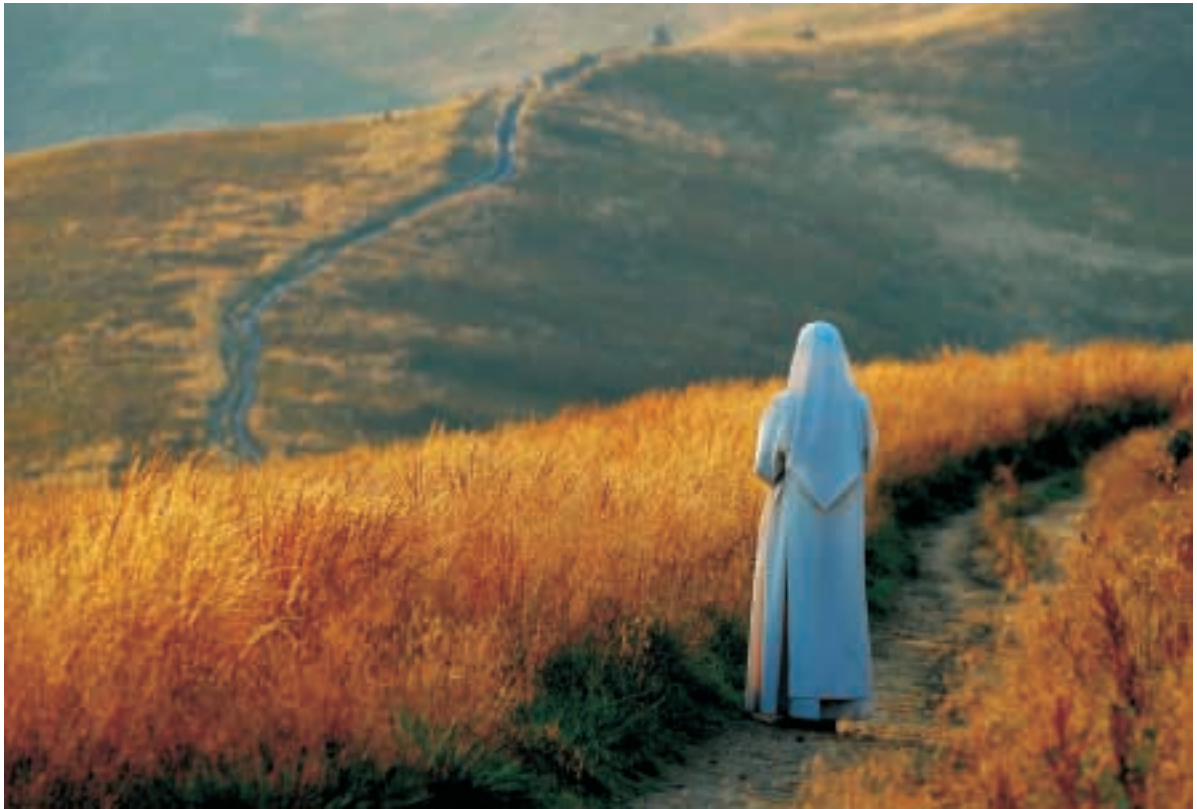
TOMASZ OKONIEWSKI „Modlitwa na koniec dnia” Nagroda Specjalna Oficyna MM Wydawnictwo Prawnicze S.C.