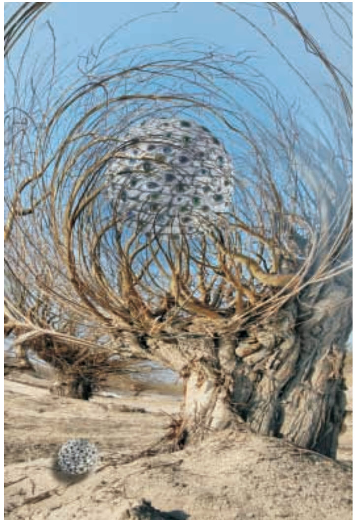
EWA SIEROKOSZ „Obcy II” Wyróżnienie