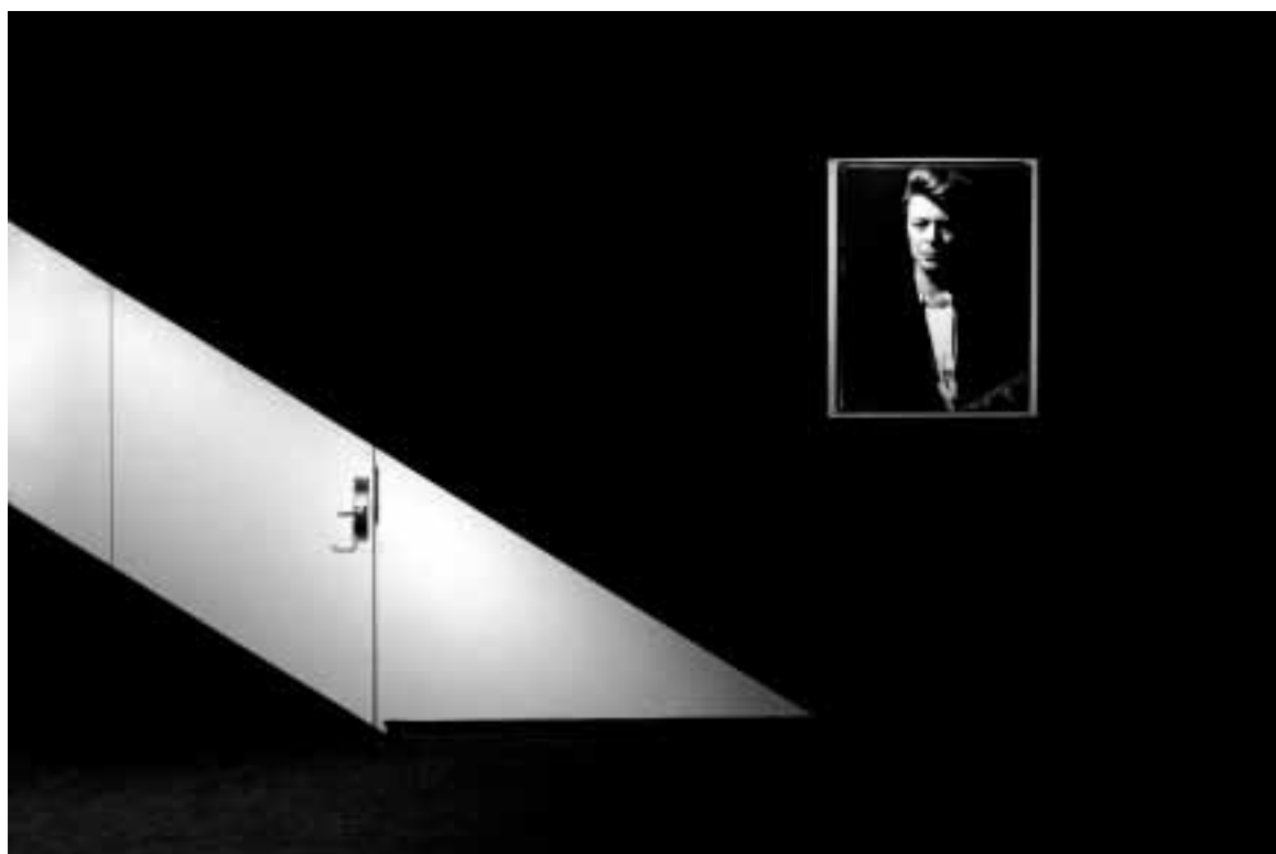
MACIEJ KUZIOR „Ostatni pokój” Wyróżnienie