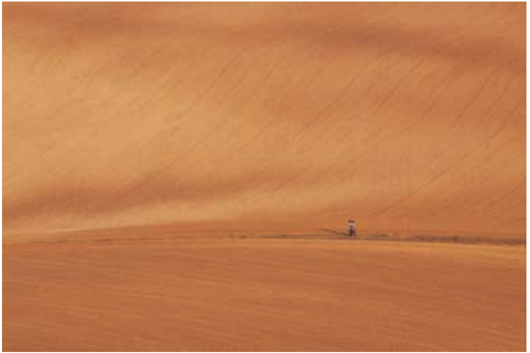
WITOLD KRÓL „Na spacerze”