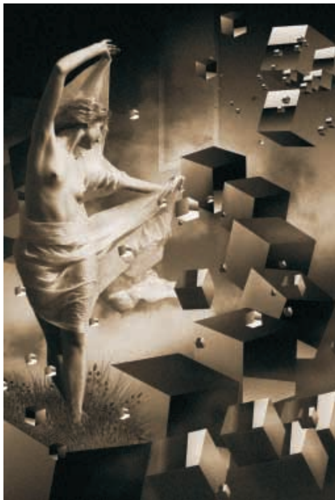
AGNIESZKA MOCARSKA „Na spacerze” III Nagroda i Brązowy Medal