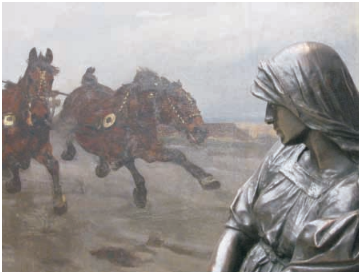
JACEK MIĘKISZ „Czas muzealny” Wyróżnienie