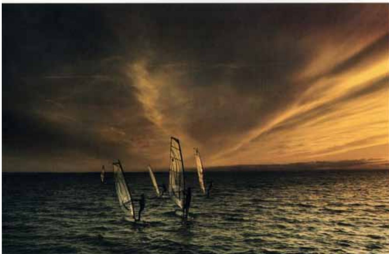
JOANNA RYBCZYŃSKA "Znaki 3" wyróżnienie