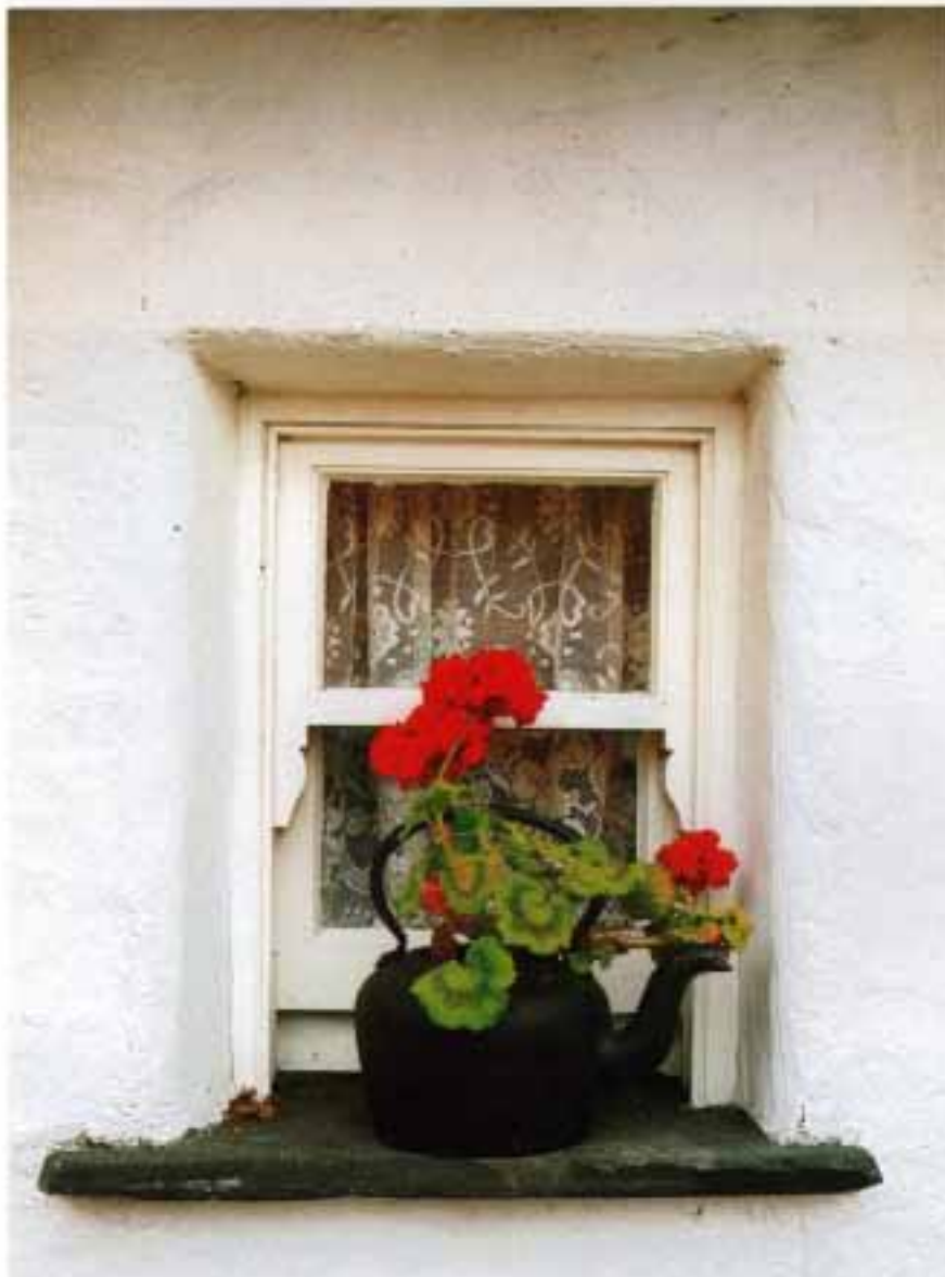
MAŁGORZATA SOKAŁA "XXX"