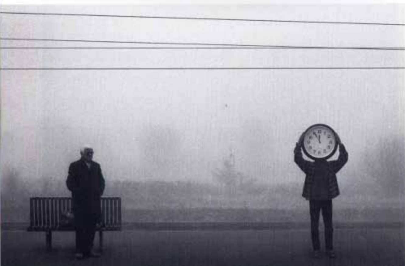
DARIUSZ KLIMCZAK "Czas odjazdu"