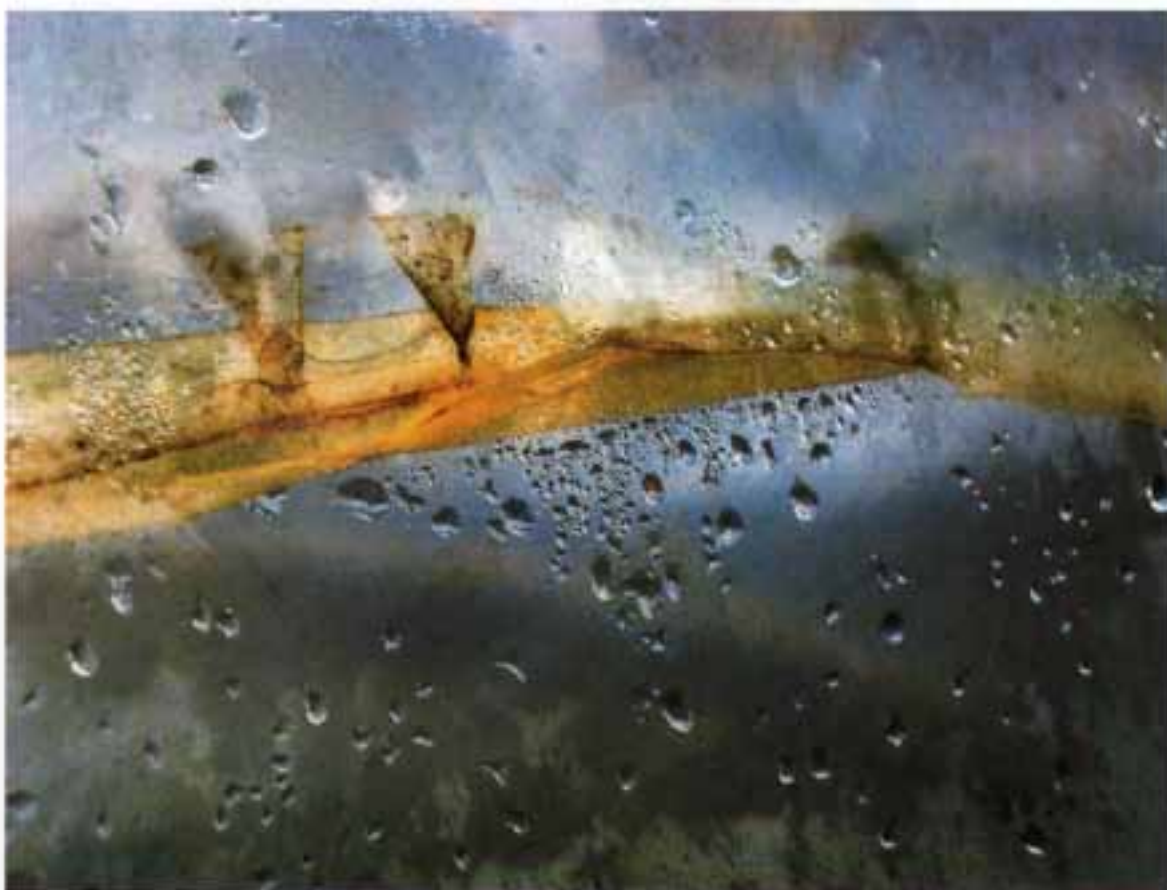
EDYTA LISEK "Przestrzenie mojej wyobraźni"

MAŁGORZATA KŁAFKOWSKA "Susza" nagroda specjalna FOTODURA Salon Fotograficzny