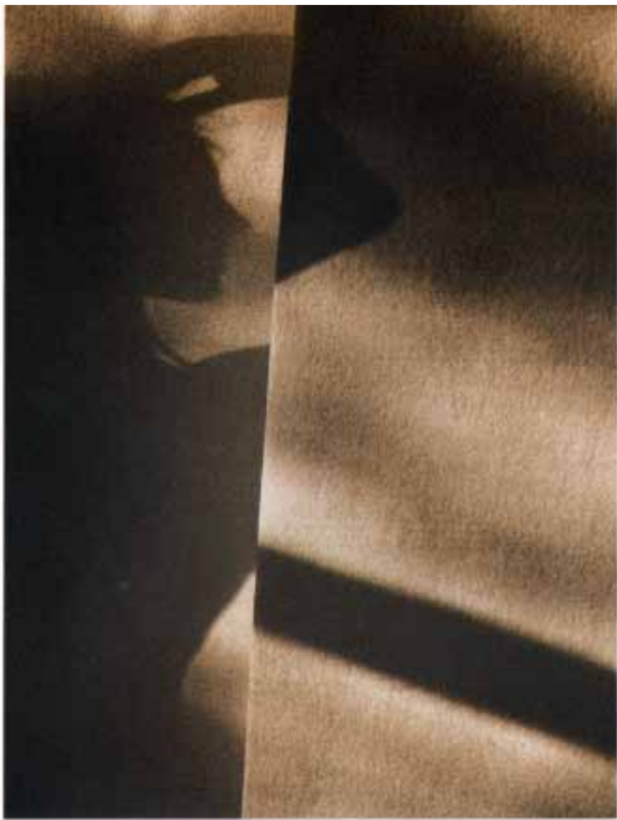
JUSTYNA BAJGROWICZ "autoportret"