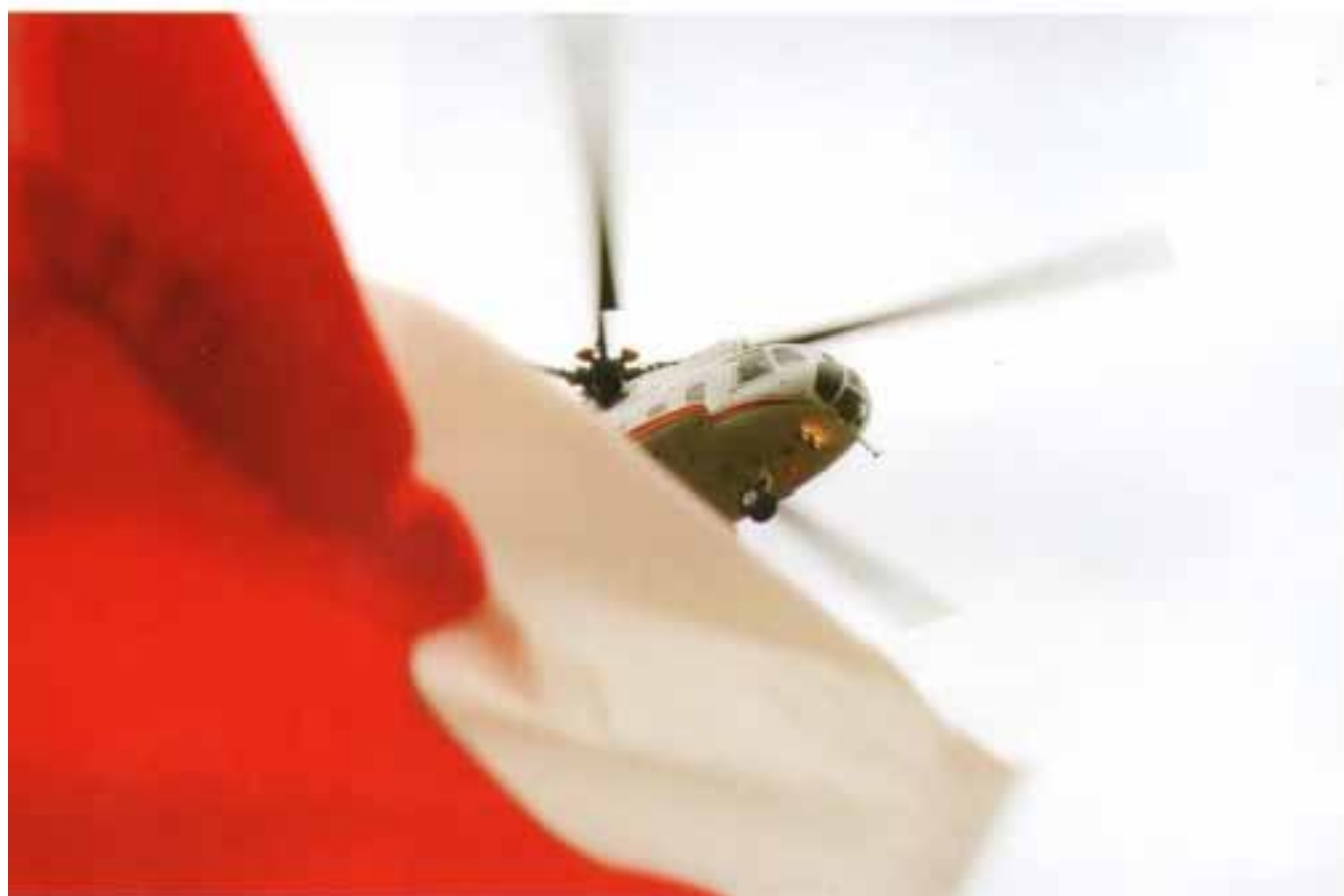
ZBIGNIEW MARKOWSKI "XXX" wyróżnienie