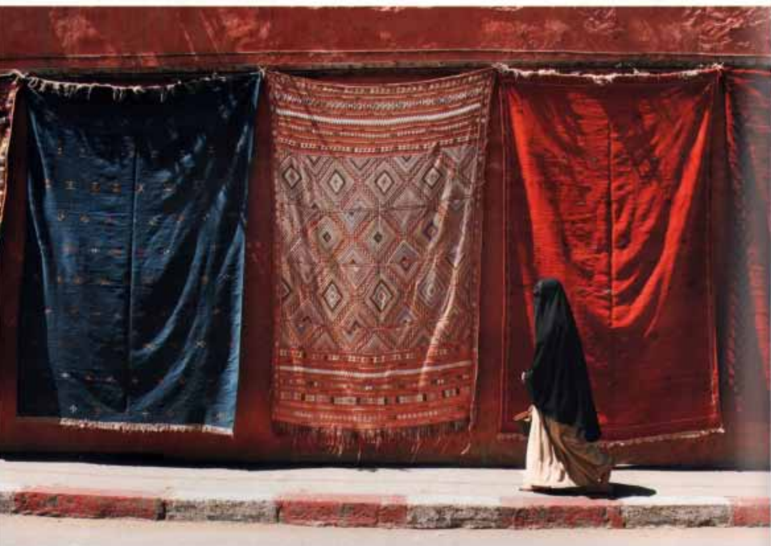
MIROSLAW MIZERA "XXX" | nagroda | Złoty Medal