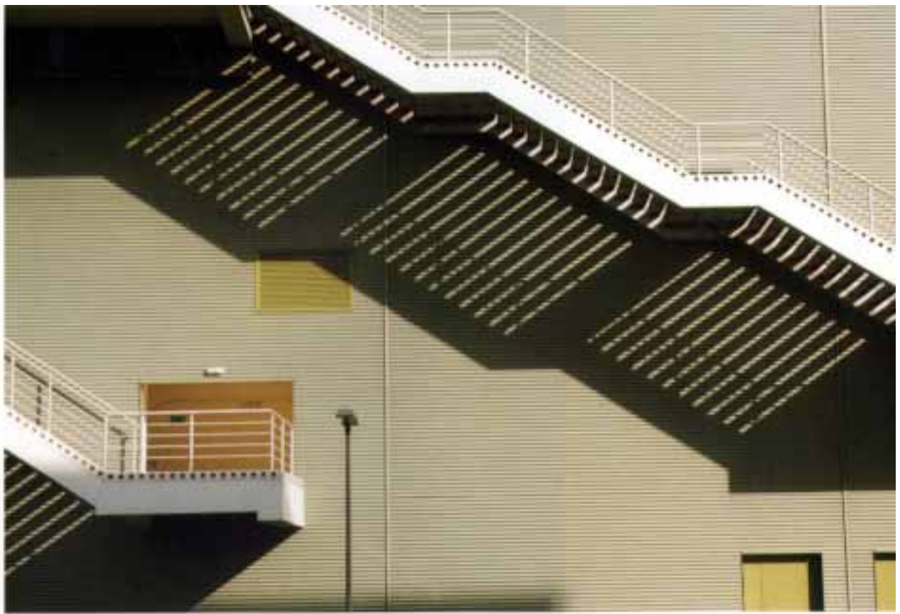
CEZARY DUBIEL "Architektura ery handlu globalnego Galaxy 3" wyróżnienie