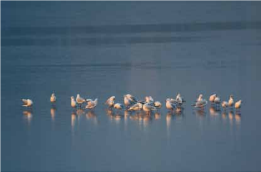
WITOLD KRÓL "Mewy na lodzie" Wyróżnienie