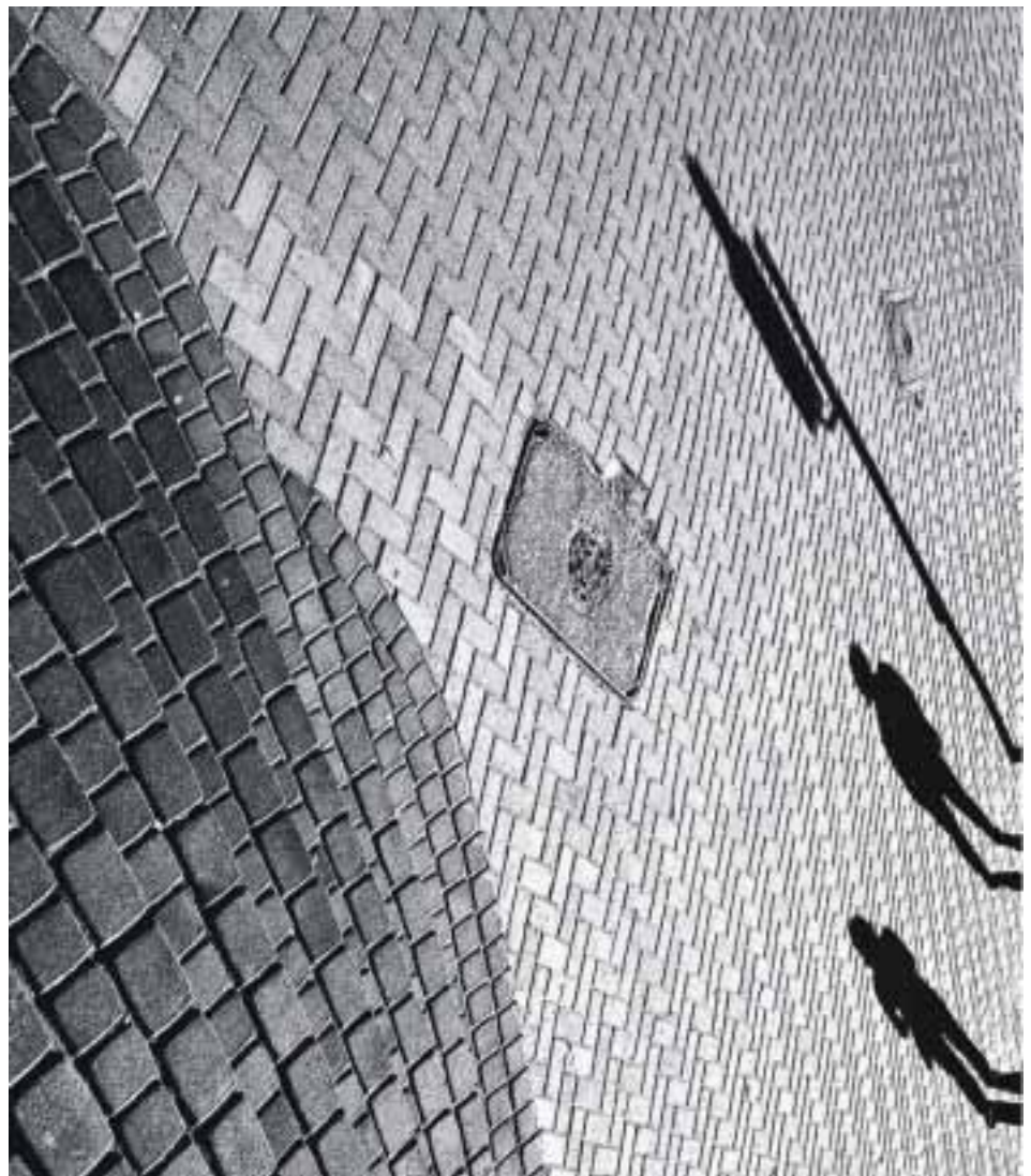
BEATA PODWYSOCKA "Sztuka chodnikowa" Wyróżnienie