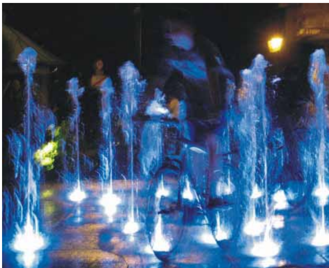
JACEK MIĘKISZ "Niebieski duet" Wyróżnienie