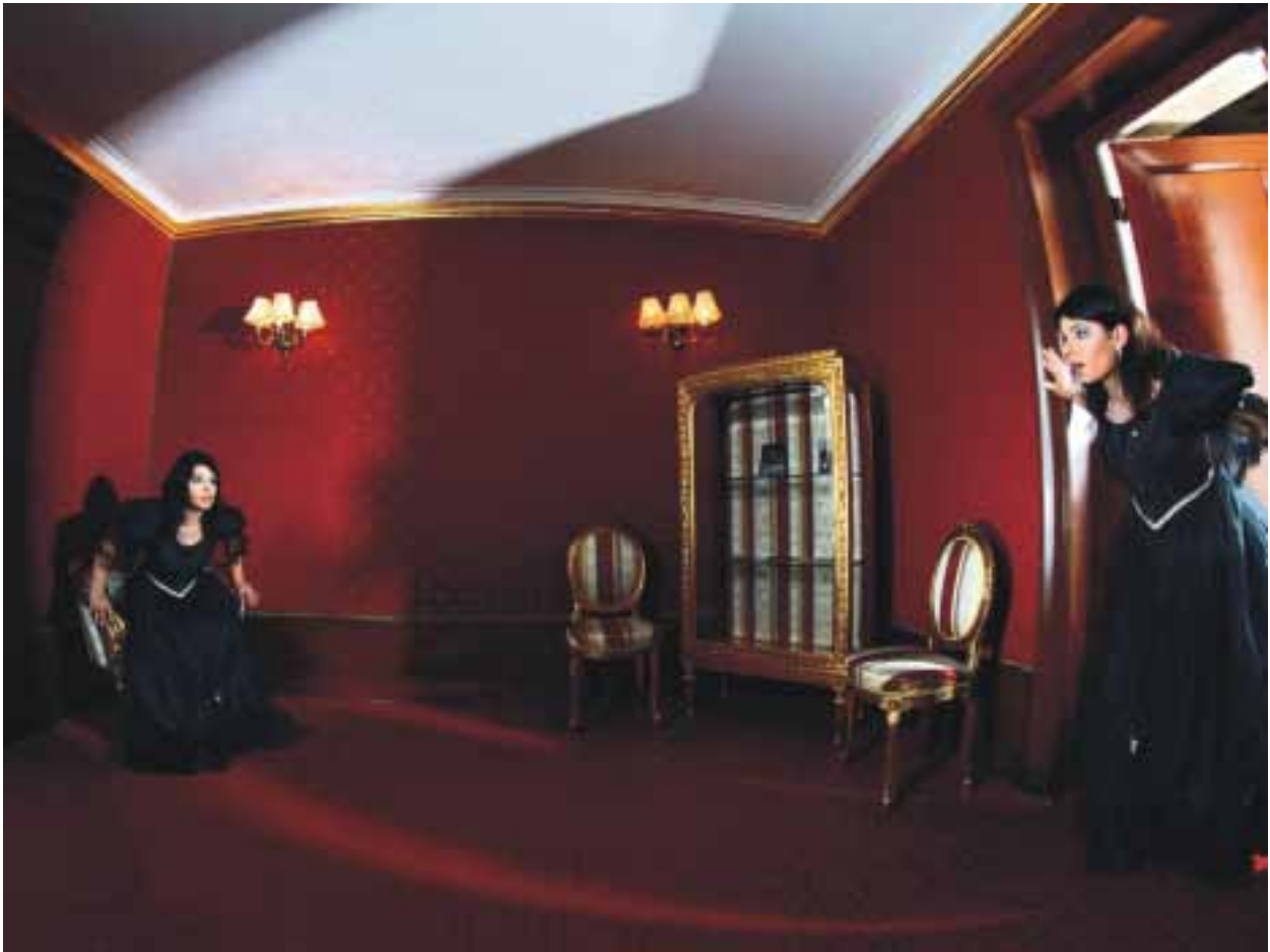
JAROSŁAW GWOŹDZIK "Sceny pałacowe X" I nagroda i Złoty Medal