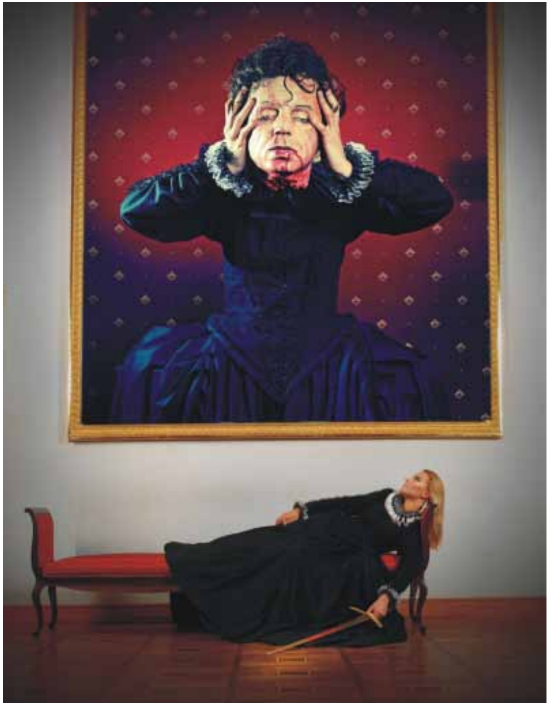
JAROSŁAW GWOŹDZIK "Sceny pałacowe VII" I nagroda i Złoty Medal