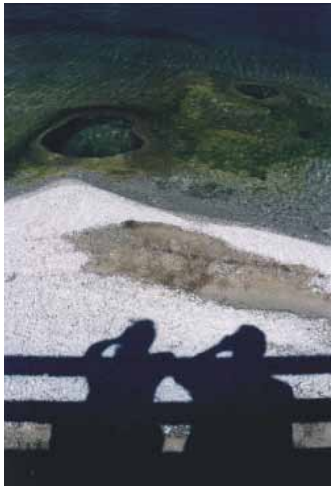
ARTUR KAMIŃSKI III nagroda