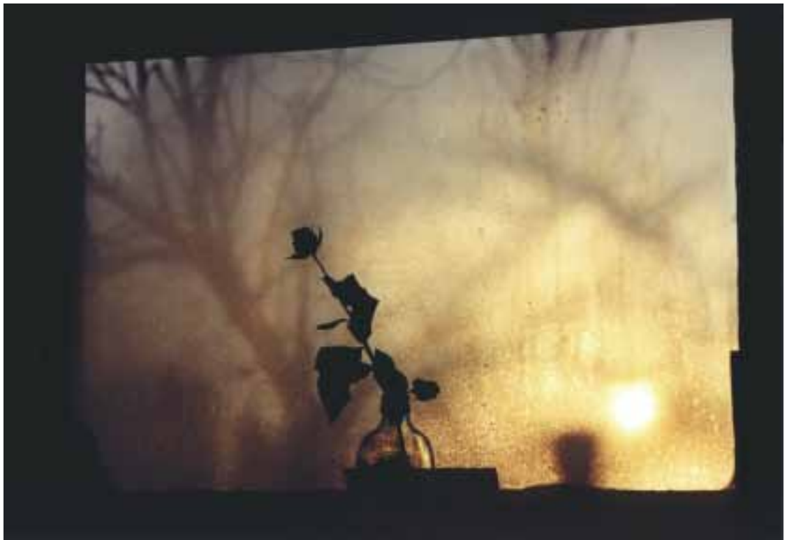
MACIEJ PACZKOWSKI II nagroda