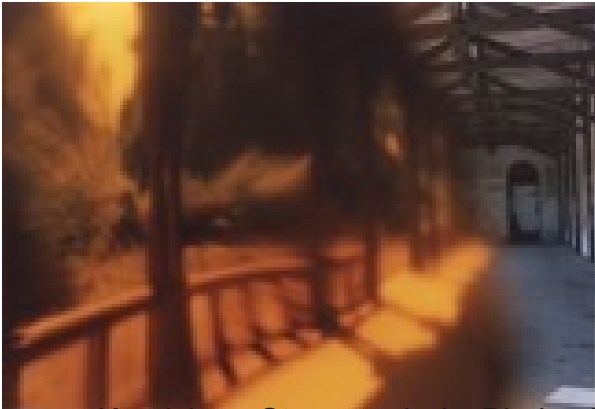
Tomasz Kandzióra Straszny dwór- Biedrusko