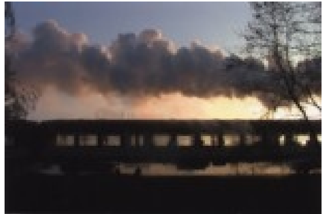
Grażyna Tasiemska Trasa Wolsztyn - Leszno