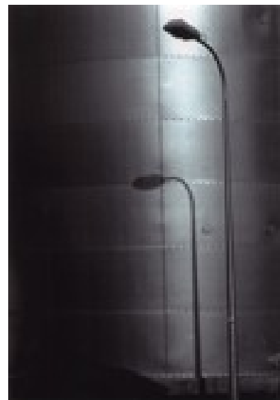
Katarzyna Wróbel Krajobrazy hipermarketu