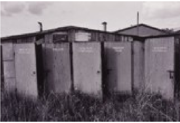
Sławomir Maciaszek Dworzec w Gołańczy