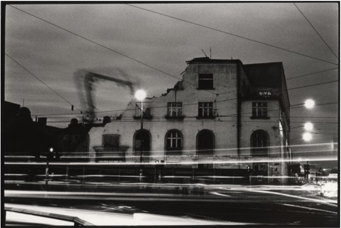
III NAGRODA Mariusz Urbanowicz Bałtyk