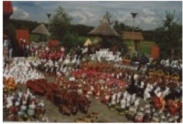
Marta Schmidt Parking przy drodze ze Świebodzina do Nowego Tomyśla