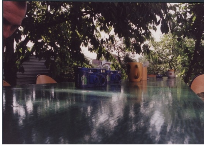
WTZ "Śmiałek" Dokument bardzo subiektywny NAGRODA