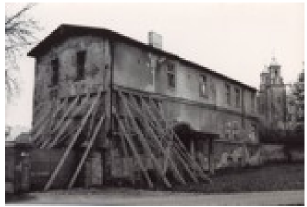
Sławomir Maciej Krzyśka Gniezno z katedrą w tle