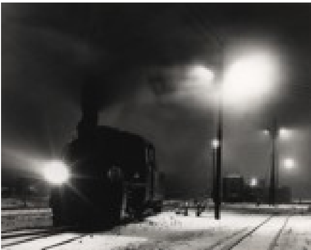
Marek Barszcz Średzka kolej wąskotorowa