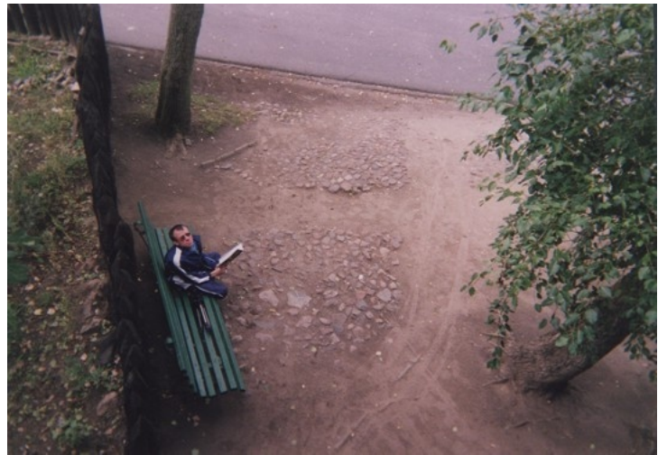
WTZ "Koniczynka" Dokument bardzo subiektywny