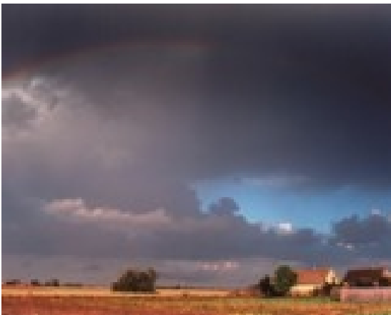
Paweł Szott Poświęta